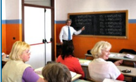
Un momento del corso di lingua italiana presso l'Istituto "Pacinotti" di Taranto

Si è concluso con la sessione di esame del 12 giugno il corso di lingua italiana per stranieri svoltosi presso l'ITIS "Pa-cinotti" di Taranto nell'ambito del Pro-getto "Italiano, lingua nostra", il pro-gramma di diffusione della lingua e della cultura italiana tra la popolazione di origine straniera residente nel nostro paese organizzato dal Centro Valuta-zioni e Certificazioni Linguistiche dell'U-niversità per Stranieri di Perugia in col-laborazione con il Dipartimento delle Li-bertà Civili e dell'Immigrazione del Mi-nistero degli Interni.